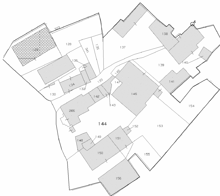
Stralcio di mappa catastale